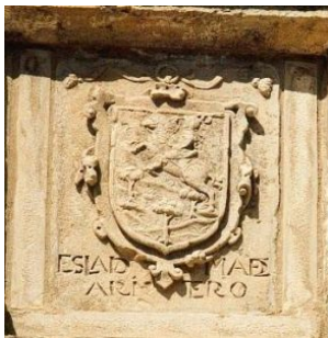
Escudo en la casa familiar de la Dama de Arintero. Arintero, León.