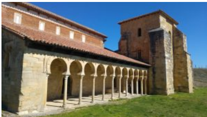
San Miguel de la Escalada, León. By M.A. Díaz