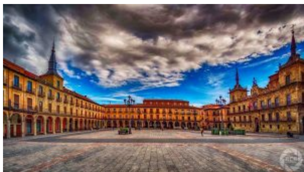
Plaza Mayor de León, by Ricardo C Blanco

De aprobarse en su inicial redacción, los principales aspectos de la Directiva del gas (como la obligación de transparencia, la disociación entre propiedad de infraestructuras y gestión de la materia energética) serían aplicables a todos los gasoductos que comunican la UE con terceros países. En la práctica actual, serían infraestructuras que acceden a la UE por una frontera marítima. Ello es así porque estarían afectados, sin perjuicio de las exenciones que en la propia propuesta se reconocen, los accesos marítimos desde Noruega, Argelia, Libia, Túnez, Marruecos y Rusia . Previsiblemente, esta propuesta también puede tener un impacto, después del Brexit , en las conexiones del Reino Unido con los Estados miembros de la UE.