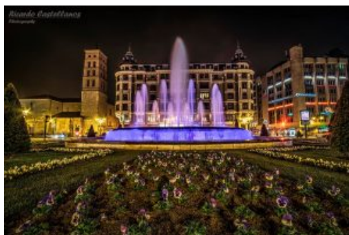
Plaza de Santo Domingo, León. R Castellanos Blanco

Además, las reformas afectarían a modernas infraestructuras y proyectos como son el Corredor del Norte (II), Northern Corridor, II entre Rusia y Alemania , de la mano de GazProm (en la que, por ejemplo, el ex canciller teutón Gerrard Schoeder ocupa un relevante puesto como administrador) y en la que aparentemente podrían identificarse problemas de disociación entre propiedad y gestión, al menos por los