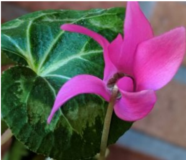
Primavera, by M.A. Díaz

Tal y como se desprende del Comunicado de prensa del Consejo de la Unión Europea, de 5 de marzo de 2019 ( aquí ), la UE pronto va a disponer de nuevas normas de control de las inversiones directas, encaminadas a un mejor control de las inversiones directas procedentes de terceros países por razones de seguridad o de orden público.