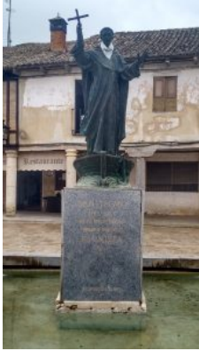
San Telmo. Frómista. Palencia