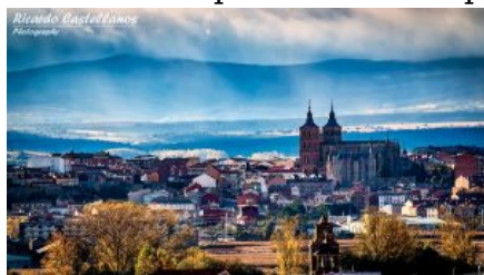
Asturica Augusta, by Ricardo Castellanos Blanco

de los riesgos a los que están expuestas. Además establece normas sobre la concesión de licencias y la supervisión de las entidades, la cooperación en materia de supervisión, la gestión de riesgos, el gobierno corporativo (incluida la remuneración) y los colchones de capital.