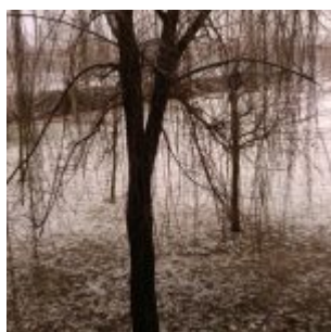
Campus universitario de León.

puedan identificar y abordar los riesgos de estabilidad financiera. La UTI facilita la agregación de transacciones de derivados OTC, al minimizar la probabilidad de que la misma transacción se cuente más de una vez (por ejemplo, porque es reportada por más de una contraparte a una transacción, o por más de un repositorio). El informe del FSB, organismo gestionado por el